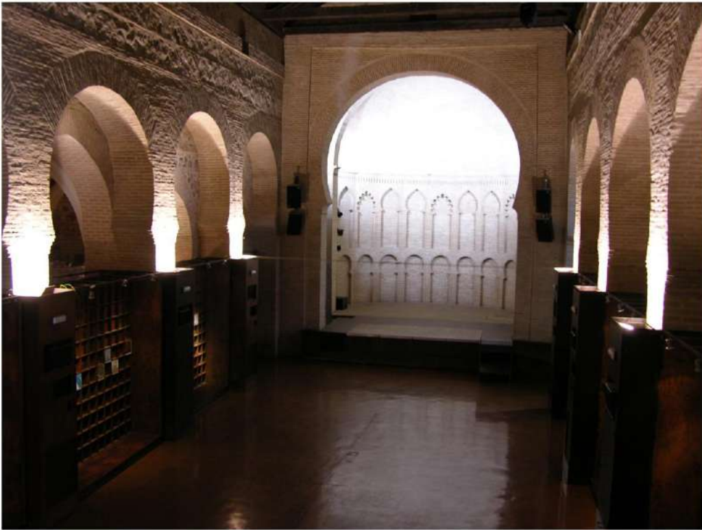
SALA PRINCIPAL. Orientación hacia el ábside (escenario).