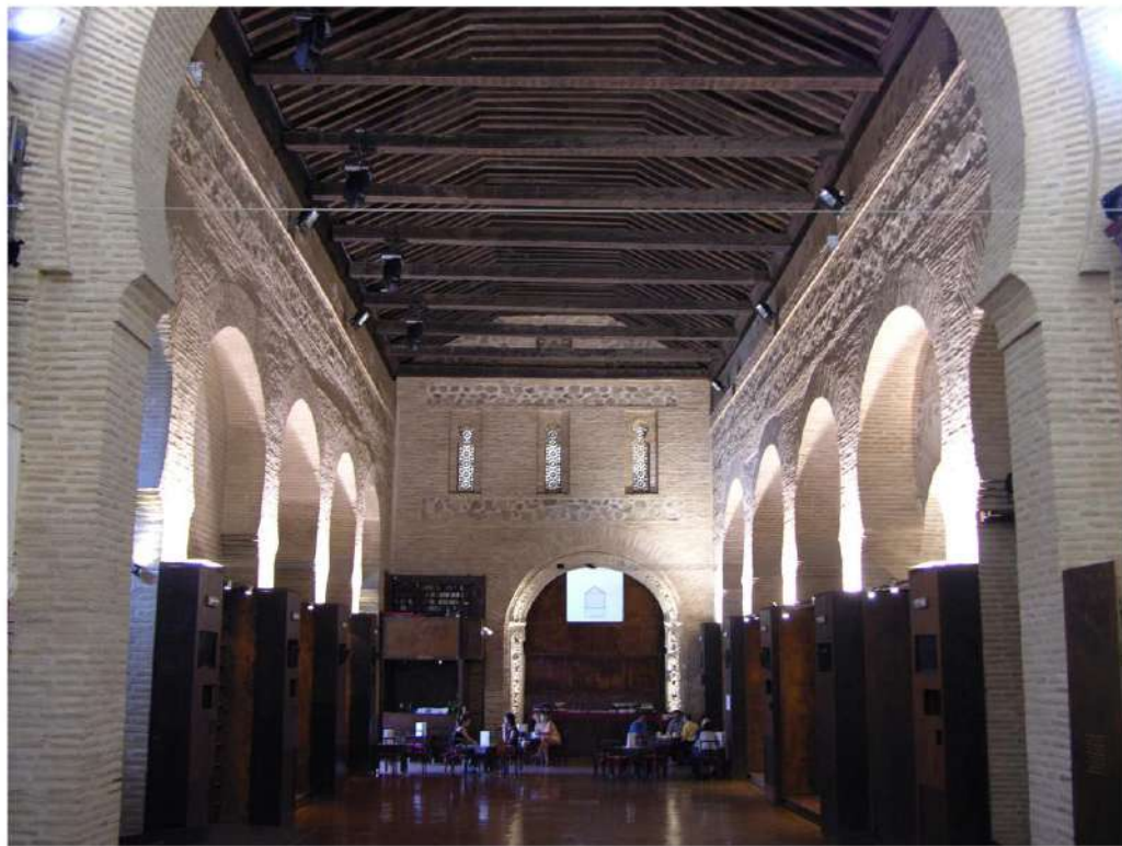
SALA PRINCIPAL. Orientación hacia el arco gótico (al fondo izqda. puerta acceso).